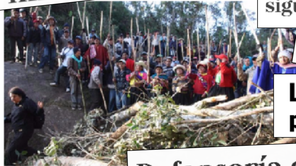
Comunidad San Juan de Cañaris

Comuneros de Cañaris vuelven a bloquear la carretera que lleva a... Comuneros insisten en impedir actividades mineras en Cañariaco Cañaris: Cronología de un conflicto que sigue sin resolverse